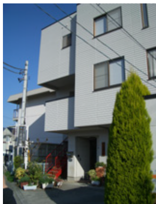
山梨県甲府市にある ㈱近藤宝飾様

当然のことながら出張の際には商品持出作業が不可欠ですが、同社では視覚的にも商品管理が行えるように、「コピー機で商品を複写して持出リストを作成する」という手順をとって来ました。単なる品番だけの管理で