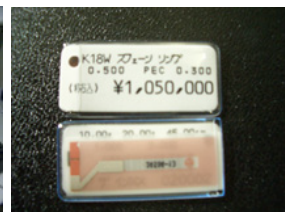
▲ 小型ICインレットを内蔵したタグ