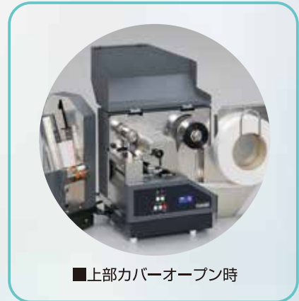
■上部カバーオープン時