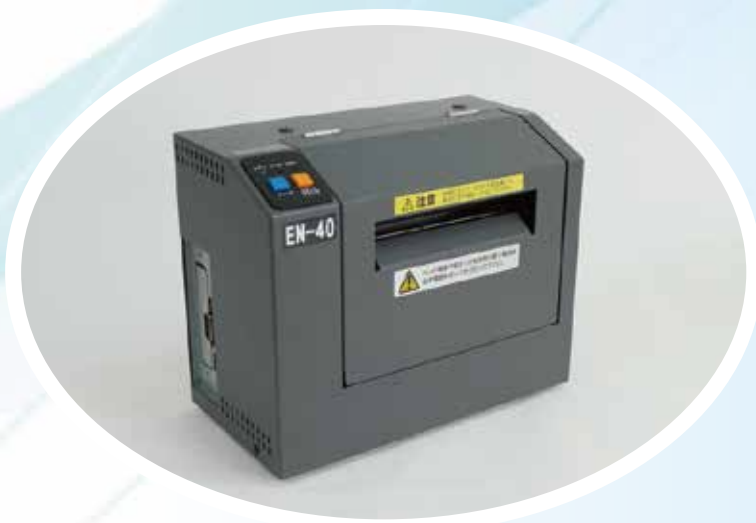
オプション カッター内蔵