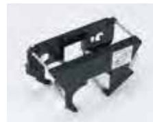
【リボンカセット】 カセットでリボン交換