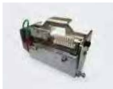
【印字ヘッド】 ワンタッチ交換可能