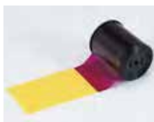
【カラーリボン】 約200画面/巻