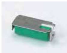
【クリーニングローラー】 粘着ローラー・カードのゴミ除去