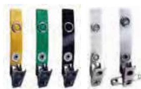
【ストラップ クリップ】