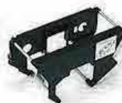
【リボンカセット】 カセットでリボン交換