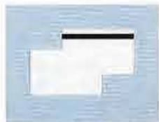
【白無地カード・磁気カード】