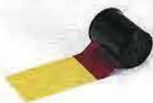
【カラーリボン】 約200画面/巻