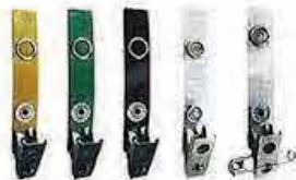
【ストラップ クリップ】