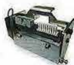
【印字ヘッド】 ワンタッチ交換可能