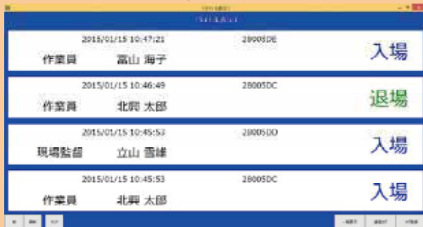
タグの電池残量も表示

入場／退場を時間順に表示します。 ※最新の入退場情報を表示 ※ICタグの登録／変更も可能