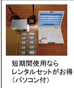
短期間使用なら レンタルセットがお得 (パソコン付)