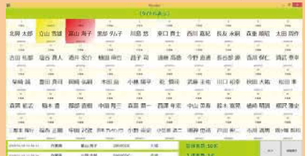
登録者数、入場者数もリアルタイムに表示

登録者を一覧で表示します。 ※入場者を赤色表示、 ※入場制限時間オーバーを黄色表示