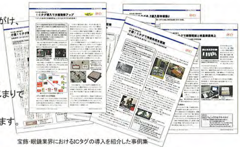
宝飾・眼鏡業界におけるICタグの導入を紹介した事例集

2004年に私どもが 小型 ICタグ を開発し宝飾・眼鏡業界にご紹介させていただいたのがはじまりで棚卸・商品持出の作業時間を大幅短縮することが認められ、多くのお客様にご導入をいただいております。