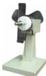
ワインダーUR110III スタンドアロン型