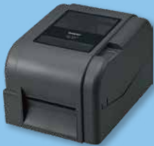
ラベルプリンター